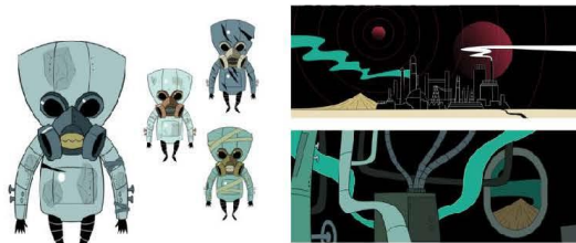
ภาพที่ 5 ภาพประกอบฉากในโลกที่ใช้ซึ่งธรรมชาติ ในสื่อแอนิเมชัน